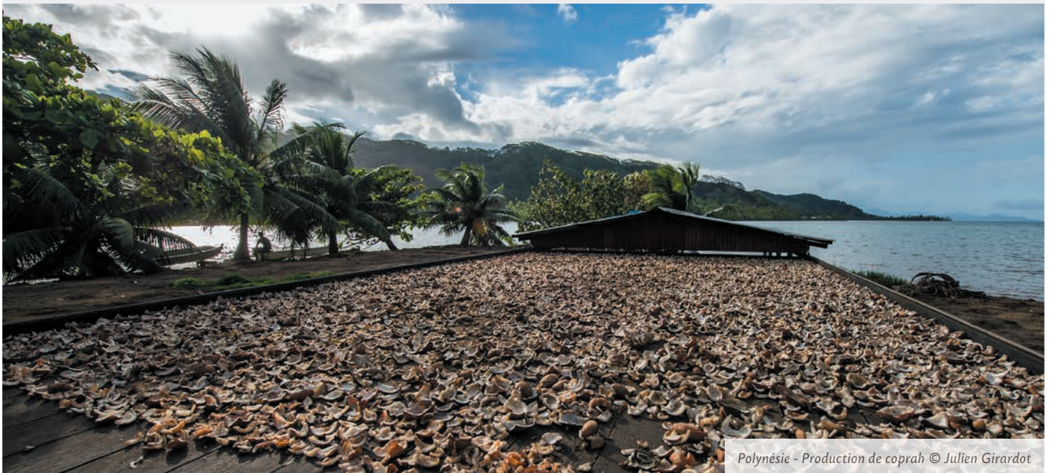
Polynésie - Production de coprah

En 2013, l'AFD a consacré 1,5 milliard d'euros au financement d'actions dans les Outre-mer, sur un total de 7,8 milliards d'euros de financements dans le monde, selon quatre axes d'intervention : l'appui au secteur public local, le financement des entreprises, l'habitat et l'aménagement urbain, la coopération régionale.