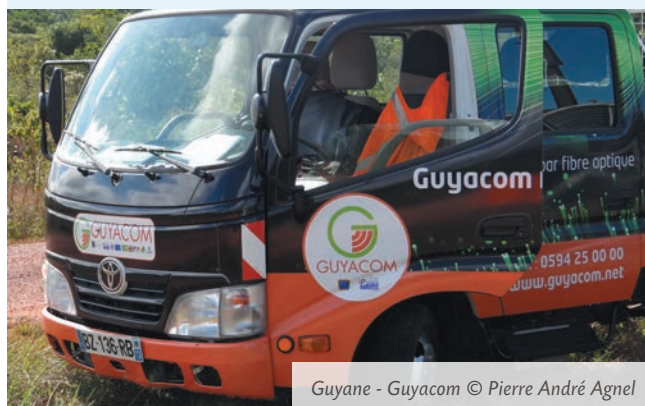
Guyane - Guyacom

L'AFD accompagne le projet de GUYACOM par l'apport d'un prêt direct de 1,2 M€. Les investissements en partie financés par l'AFD concernent principalement la pose de la fibre optique entre Cayenne et Saint-Georges de l'Oyapock. Le projet est également supporté par des financements bancaires et des subventions nationales comme le Conseil Régional et Général de Guyane, le Centre National d'Etudes Spatiales (CNES) et l'Union européenne (PO Amazonie).